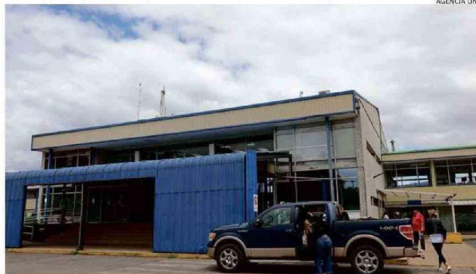
EL PROYECTO CONSIDERA LA AMPLIACIÓN DE LAS INSTALACIONES DE CAÑAL BAJO.

el alargue de pista pasando de 1.750 a 1.950 metros de largo, pensando en el aterrizaje de aviones modelo Airbus A320 usado en rutas nacionales.