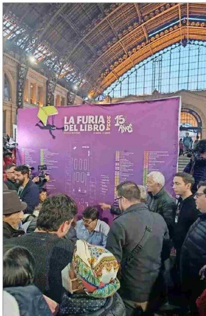
El alcalde de Recoleta, Daniel Jadue, participó de la "Furia del libro", en Estación Mapocho; allí, firmó ejemplares y compartió con visitantes al evento.

"El día lunes se va a conocer cuál es la cautelar que asume la jueza y la cautelar no es una sentencia, pero sí da una señal de en qué tono de gravedad han puesto la acusación contra Daniel Jadue. Me preocupa mucho, porque no se trata de investigar o