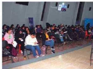
Personas presenciaron y fueron participes de la Obra de Teatro LOS MAZALEZ en Iquique.