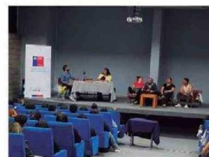
Personas presenciaron y fueron participes de la Obra de Teatro LOS MAZALEZ en UTA Arica.