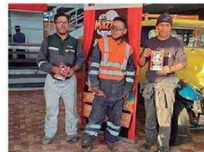
Personas presenciaron y fueron participes de la Obra de Teatro LOS MAZALEZ en Calama.