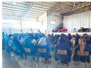
Personas presenciaron y fueron participes de la Obra de Teatro LOS MAZALEZ en La Serena.