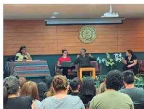
Personas presenciaron y fueron participes de la Obra de Teatro LOS MAZALEZ en Santo Tomás Arica.