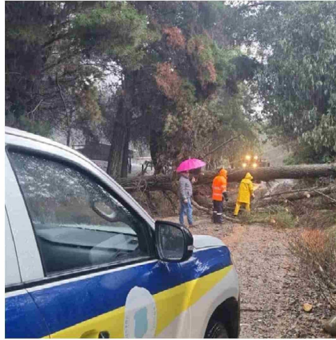
Caos en Angol