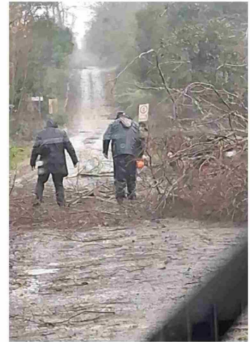
Camino Las Mariposas