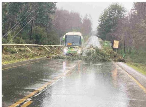
Ruta 181 km 17

También dijeron que "en la comuna de Angol hubo 27 incidentes entre fallas masivas e individuales con 930 clientes afectados, los que se concentran en Vegas Blancas, Villa Coyanco, todo el cordón Cordillero con 480 clientes, Colonia Manuel Rodríguez 241 clientes, siendo éstas las más críticas. El resto de fallas son individuales o algunas sub estaciones que sufren afectaciones. El recurso esta asignado y ya desplegado para atender estas solicitudes".