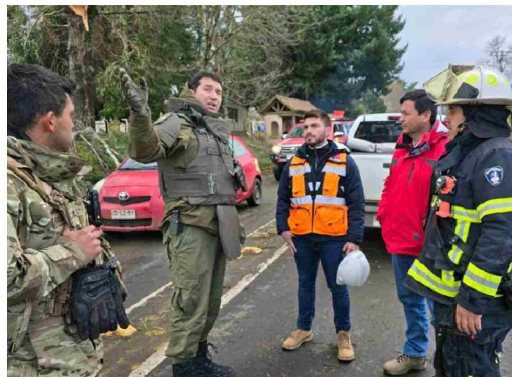
Autoridades atendiendo caminos cortados