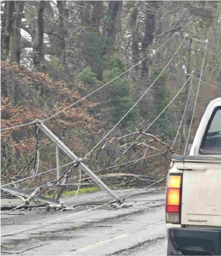
Traiguén Victoria a la altura de Quichamahuida

Tiraje: 3.600 Lectoría: 13.800 Favorabilidad: No Definida