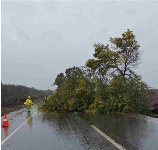
Caída de tendido eléctrico Ruta 86