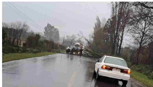
Ruta CH181, Victoria - Curacautín