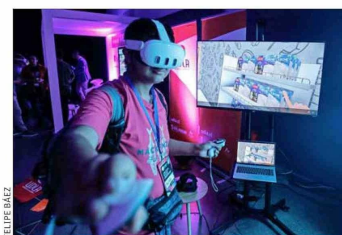
La UDLA exhibió una aplicación de realidad virtual que ayuda a personas de la tercera edad con deterioro cognitivo. Todos los asistentes la pueden probar.