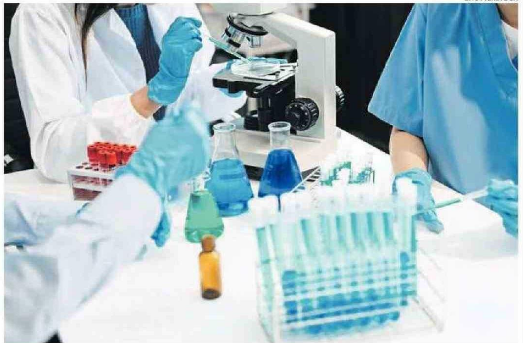
LA ORGANIZACIÓN URGIÓ A UN TRABAJO COLABORATIVO GLOBAL.

Según el informe, elaborado por 200 científicos de