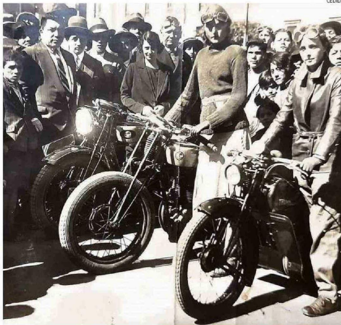
PILOTOS PREPARADOS PARA EL CAMPEONATO DE LAS 100 MILLAS EN LA DÉCADA DE 1950.

1943 fue el año en que inició el torneo de carreras entre Valparaíso y Casablanca por el Camino Viejo a Santiago.