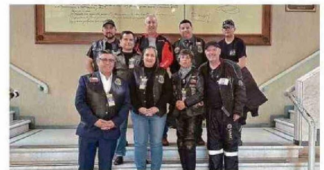
LA DIRECTIVA DEL CLUB FUE RECIBIDA EN EL CONGRESO NACIONAL.

“Queremos demostrar que los clubes de motos no solo están para juntarse y manejar. Somos personas con sentido social, con impacto cultural y de-