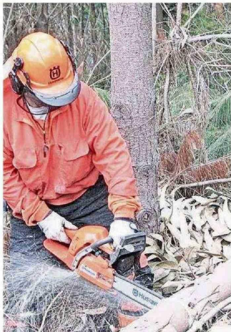
LA INDUSTRIA FORESTAL EMPLEA A MILES DE PERSONAS EN CHILE.

Sin embargo, señaló que “una de las complejidades más grandes para el desarrollo es la falta de fomento para las pymes y el alto nivel de concentración que tiene la industria. Chile tiene mucha concentración en varias áreas y eso es un peligro para