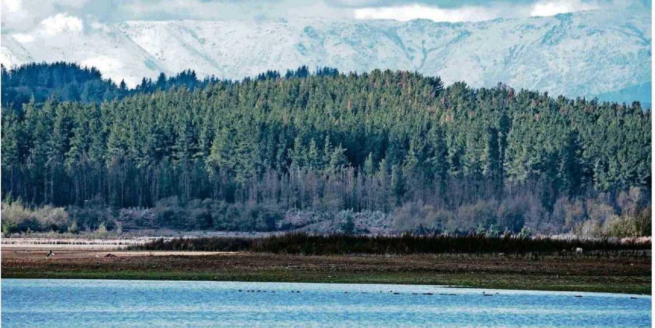
EN LAS ÚLTIMAS DÉCADAS EXTENSAS ÁREAS DE LAS REGIONES DEL BIOBÍO Y ÑUBLE HAN SIDO UTILIZADAS EN LA PLANTACIÓN DE ESPECIES DESTINADAS AL DESARROLLO DE LA INDUSTRIA FORESTAL CHILENA.

PROYECCIONES. Avanzar hacia la bioeconomía con uso de energías verdes y la construcción sustentable forman parte de las propuestas para ambas regiones en esta área. Gremios y expertos valoran el potencial de este sector como clave para el desarrollo.