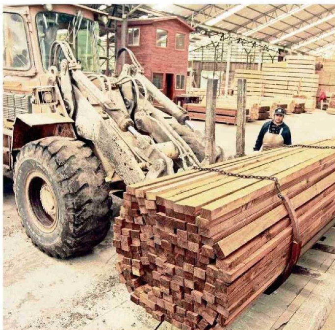
GENERAR MÁS CONSTRUCCIÓN EN MADERA ES UNO DE LOS DESAFÍOS PRESENTES EN EL SECTOR.