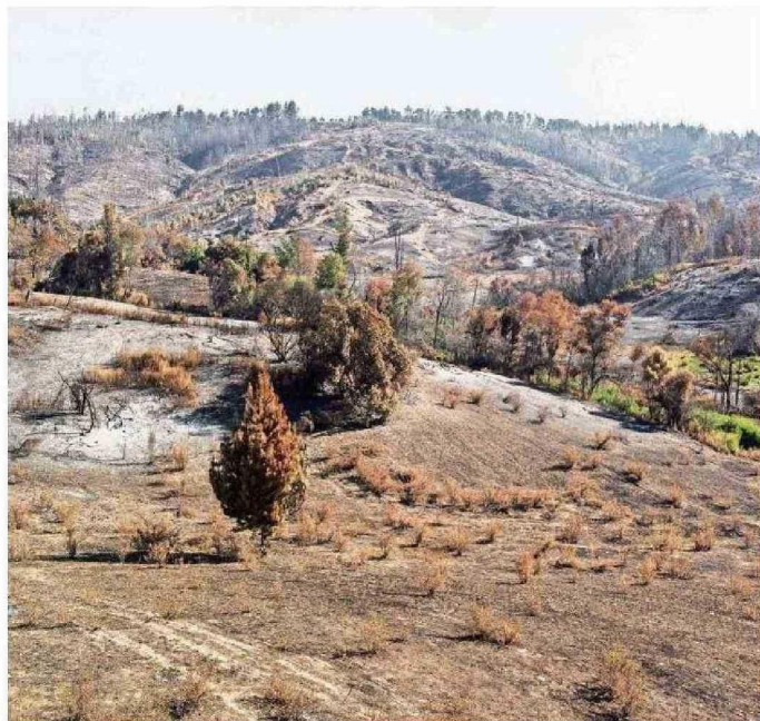
LOS INCENDIOS FORESTALES SON UNA DE LAS PRINCIPALES AMENAZAS QUE ENFRENTA LA INDUSTRIA.