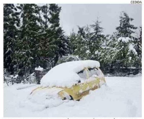
EN ALGUNAS ZONAS DE FUTALEUFÚ LA NIEVE CAÍDA SUPERÓ LOS 40 CM.