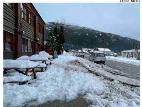
EN EL RADIO URBANO DE FUTALEUFÚ PIDIERON EL DESPEJE DE VEREDAS.

le, las temperaturas en la zona cordillerana (Futaleufú) se mantendrán en torno a los cero grados lunes y martes.