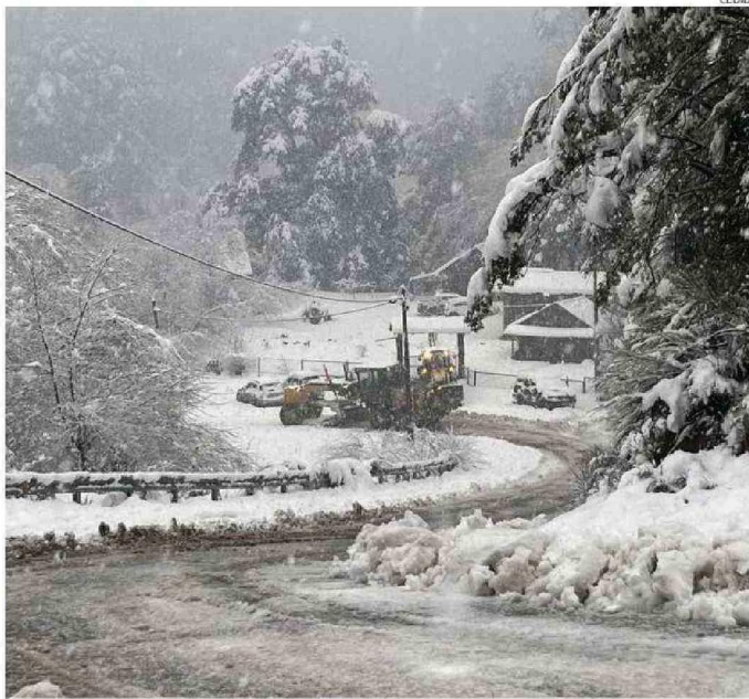
CON MAQUINARIA PESADA SE DEBIÓ REALIZAR EL DESPEJE DE LAS RUTAS, POR LA NIEVE Y CAÍDA DE RAMAS.

La autoridad recorrió durante la jornada de este sábado diversos caminos secundarios hasta el sector El Límite, fronterizo con Argentina, donde constató la importante acumulación de nieve. "La mayor afectación que se ha producido es con las líneas de celular, que se cayeron todas las redes y ahora se están recuperando a medida que se recuperó la fibra óptica (pasadas las 16:30 horas de ayer). Lo mismo reportaron en Palena donde tienen todas las antenas de celular caídas", detalló. De igual manera, de acuerdo a lo que fue informado en reuniones de Cogrid (Comité para la Gestión del Riesgo de Desastres) comunales realizadas en Futaleufú y en Palena, la mayor preocupación estuvo centrada en la suspensión del suministro eléctrico en parte del radio urbano de Palena. "Este no ha podido ser repuesto porque la línea que conecta