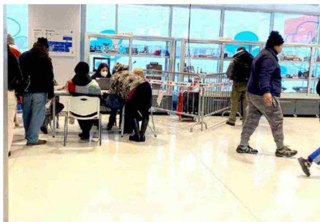
Quienes han acudido al recinto durante los últimos días, han notado el frío que se siente dentro del Hospital.