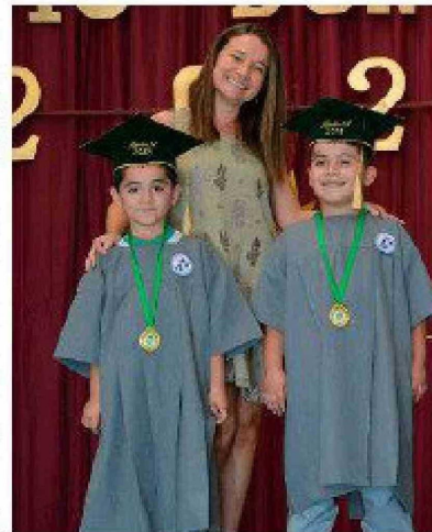
Los alumnos destacados de kínder.