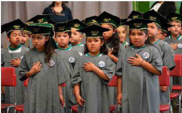
Emotiva licenciatura de kínder del Colegio Don Bosco de Rancagua.