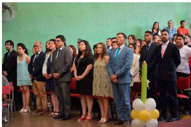
Comunidad educativa, padres, apoderados y familias acompañaron a los niños en el importante momento.

Con discursos, diplomas y alegría, los alumnos de kínder A y B dieron el importante paso hacia la enseñanza básica en una ceremonia cargada de emoción.