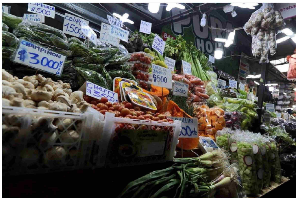
VARIACIÓN SEMANAL DE PRECIOS DE HORTALIZAS

En detalle la papa en ferias libres promedió un valor de $877 el kilo, lo que equivale a un incremento de 12,7%. El pimiento subió un 7,8%, lo que representa cerca de $40 más por unidad hasta los $556 por cada uno.