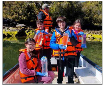
Muestreo de ADN ambiental con los niños y niñas de Puerto Cisnes... foto autorizada