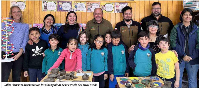
Taller Ciencia & Artesanía con los niños y niñas de la escuela de Cerro Castillo

Título: Proyecto MOBI-Aysén presentará resultados de monitoreo con ADN Ambiental en áreas silvestres protegidas de la región