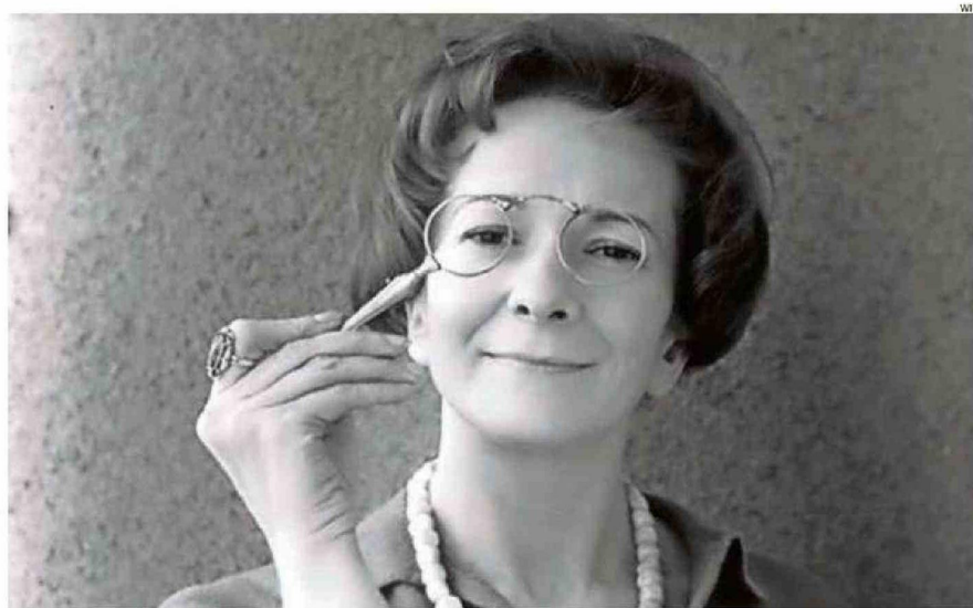
LA AUTORA RECIBIÓ EL PREMIO NOBEL DE LITERATURA EN 1996.

A remitentes con nombre y apellido aparecen respuestas como "lo que vamos a decir a continuación suena muy demoralizador: es usted una persona demasiado franca y cándida para escribir bien. En las entrañas de un escritor con talento se arremolinan los más diversos demonios. E incluso si antes o después de escribir se encuentran adormecidos (o deberían encontrarse adormecidos), durante la escritura tienen una frenética actividad. Sin su ayuda, el escritor no podría adentrarse en las complicadas vivencias de sus personajes. Nada humano me es ajeno: ¡oh, esta sentencia no se puede aplicar a las vidas de los santos bondadosos! Reciba