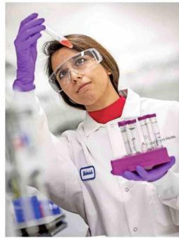
Descubrir, desarrollar y ofrecer medicamentos innovadores que ayuden a los pacientes a superar enfermedades graves son los objetivos de Bristol Myers Squibb.

enfermedades graves son los objetivos de Bristol Myers Squibb, y la inversión que realizará en Chile reforzará su programa de desarrollo clínico en cinco áreas terapéuticas: oncología, inmunología, hematología, fibrosis y neurología.