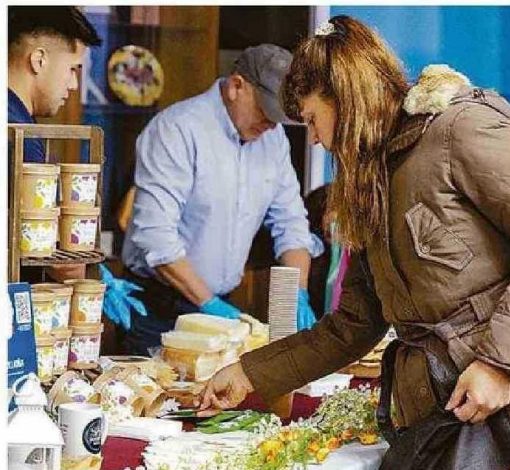
PRODUCTORES AGRÍCOLAS, APÍCOLAS, CHOCOLATEROS, ARTESANOS Y MUCHOS MÁS SE REUNIRÁN EN VALPARAÍSO.

ción cuenta con la colaboración del Gobierno Regional, municipios de Valparaíso, Concón, Santa Domingo, además de Indap, Sernatur, ProChile, Sercotec y Ministerio de las Culturas entre otros.