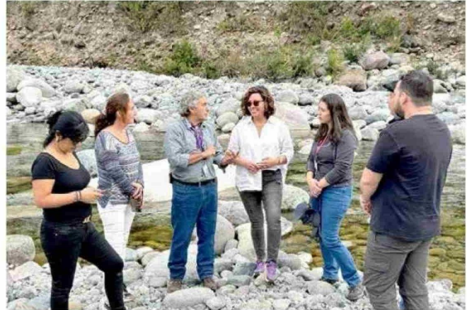
La seremi aseguró que "hemos dado un paso más hacia la anhelada gobernanza de nuestro santuario".