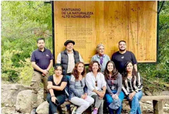
Este comité desarrolló su cuarta sesión en terreno.