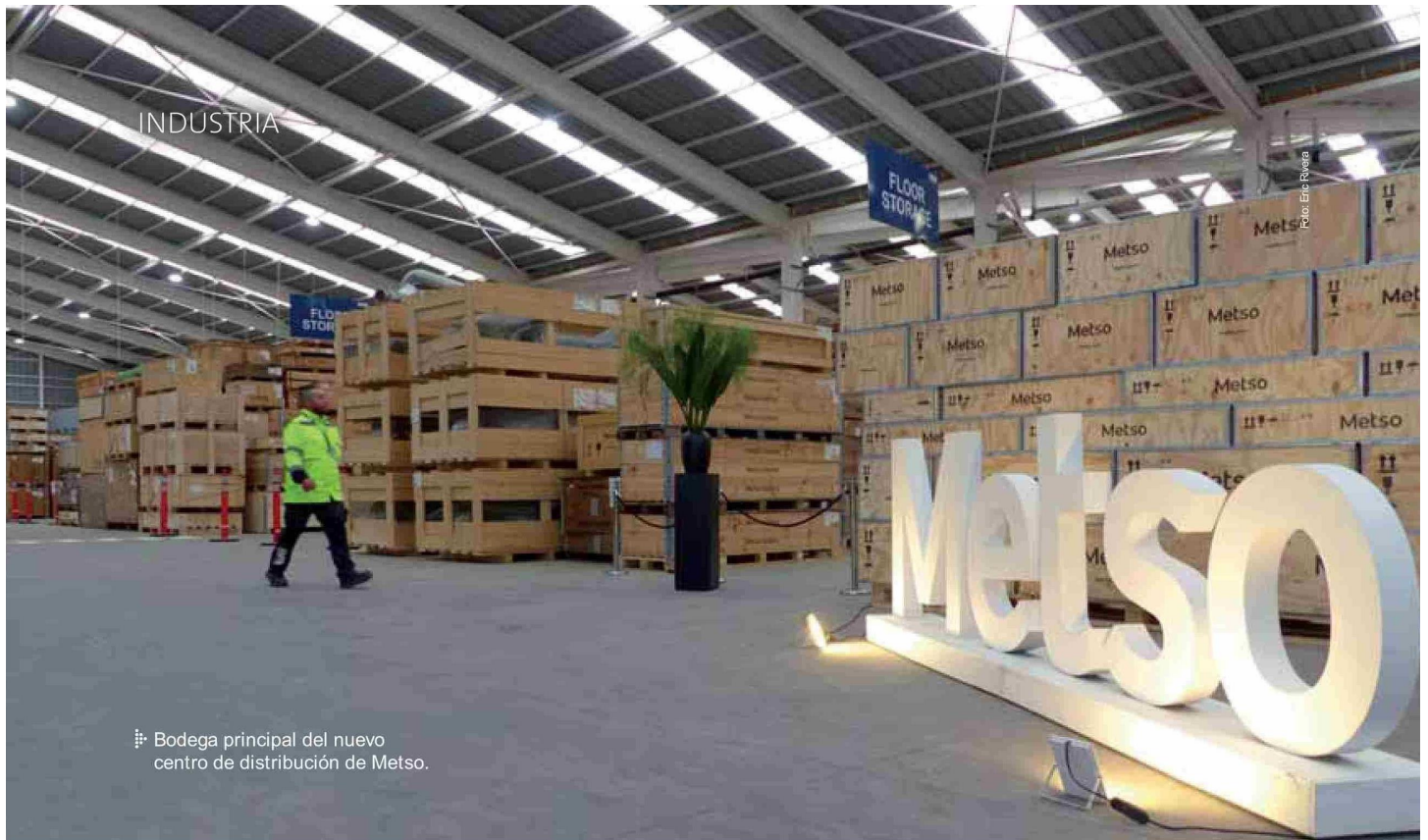
📍 Bodega principal del nuevo centro de distribución de Metso.