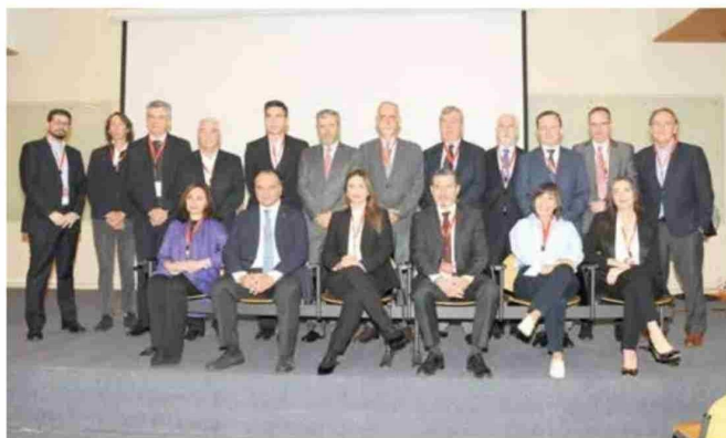
Firmantes de la Declaración de Santiago + 30.

“Es gracias al trabajo de la prensa, su valentía y perseverancia, rigor y sentido crítico que las sociedades se informan, y toman decisiones que finalmente impactan en su devenir democrático. En el marco del Día Mundial de la Libertad de Prensa que se celebra en nuestro país, es necesario relevar el rol de la prensa