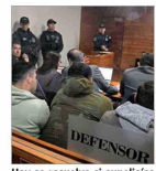
Hoy se resuelve si expolicías quedan en prisión preventiva.

Pago de $300 mil y entrega de radio, entre imputaciones a excarabineros en el caso Brink's | C 7