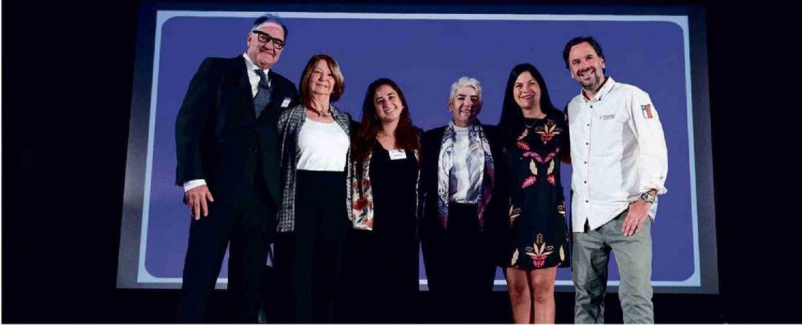
BANCO DE CHILE