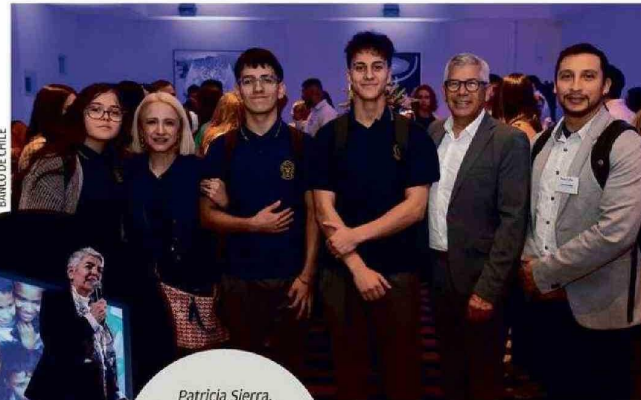
BANCO DE CHILE

“Nos tiene tremendamente felices esta alianza junto a Banco de Chile, que nos permitirá transformar la vida de estudiantes de escuelas vulnerables a través del poder de la lectura. Cuando un niño o niña aprende a leer, cambia su forma de ver y enfren-