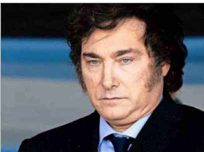
Javier Milei , Presidente de Argentina.

El mandatario trasandino aludió a la tendencia política del exministro de Hacienda chileno que actualmente dirige el Hemisferio Occidental del organismo internacional.