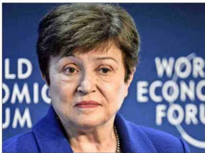
Kristalina Georgieva , directora gerente del FMI.