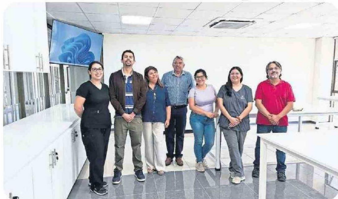
Nuevo laboratorio de Tecnología Médica.

metros cuadrados de áreas destinadas a jardines y terrazas posee la sede penquista.