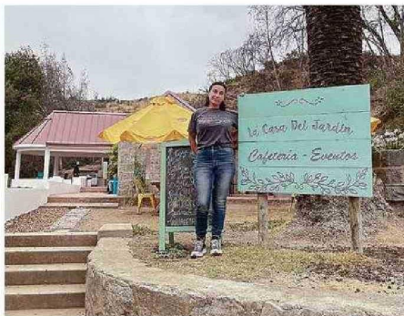
EL LETRERO SE SALVÓ DE LAS LLAMAS, UN SÍMBOLO DE RESISTENCIA.

El Cactario no sufrió daños, y aunque la colección de Valdivia un poco, los árboles ya han comenzado a brotar, mostrando