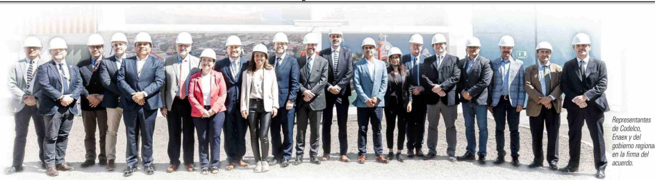
Representantes de Codelco, Enaex y del gobierno regional en la firma del acuerdo.