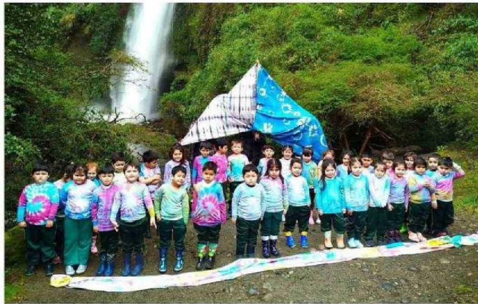
EL COLEGIO SANTA ANA DE QUEMCHI REALIZÓ SU INTERVENCIÓN EN LAS CASCADAS DE TOCOIHUE.