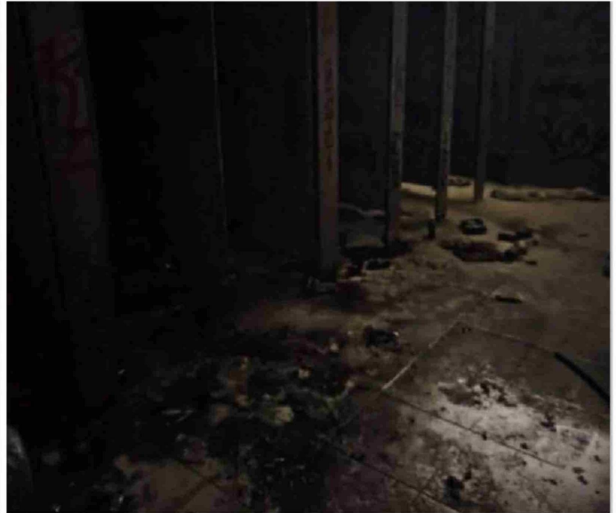
► Imágenes de los baños al interior del Internado Nacional Barros Arana después del siniestro causado por el estallido de las bombas molotov.