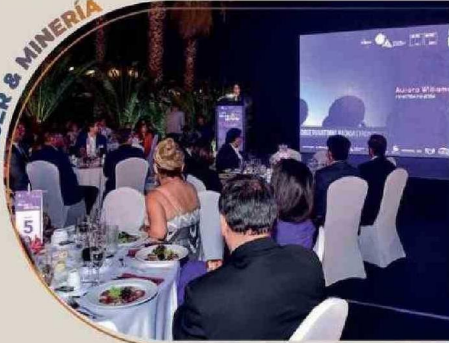
Liderazgo femenino y su rol en la industria minera, foco de este espacio que convocó a 300 participantes.