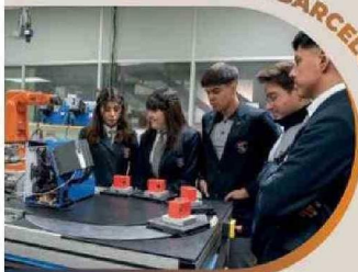
Estudiantes y docentes de Antofagasta y Calama, fortalecieron conocimientos y experiencias en España.