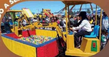
En Antofagasta y Calama, 3.000 niños conocieron de manera interactiva este mundo productivo.