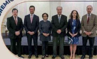
AIA congregó a líderes nacionales, posicionando a EXPONOR como palanca del crecimiento país el 2024.