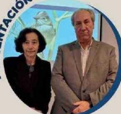
Rossana Costa, Presidenta del Banco Central, destacó el crecimiento económico impulsado por la industria minera y energética, reflejado en el Informe de Política Monetaria.