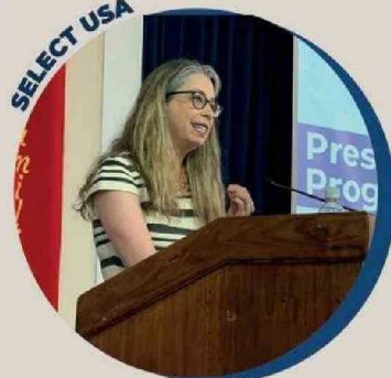
Bernadette Meehan, Embajadora de EE.UU., presentó las oportunidades de negocios para PYMES en ese país.