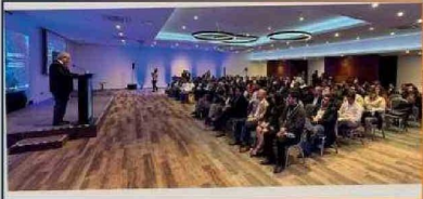
Nuevas tecnologías y herramientas digitales para las PYMES, fue el tema central de este encuentro de innovación.