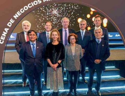
AIA celebró sus 80 años junto a más 1.200 ejecutivos de la industria minera, autoridades y líderes nacionales.