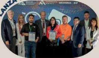
Cobra Ingeniería y WM Technologies SPA obtuvieron el primer y segundo lugar, en la séptima edición de este certamen nacional.