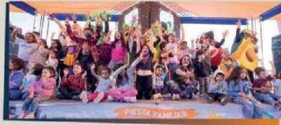
Los Frutantes, juegos, talleres y mucho más convocaron a 10.000 asistentes, en esta fiesta de compromiso con el desarrollo integral de la infancia regional.