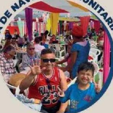
Mil niños del Servicio Mejor Niñez, barrios transitorios y jardines infantiles disfrutaron en familia, de este especial momento.