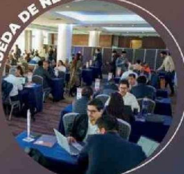
Sobre mil reuniones de negocios y 600 empresas asistentes, a este networking con proveedores.