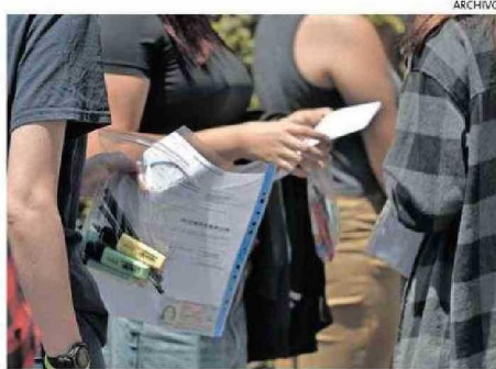
MILES DE ESTUDIANTES RENDIRÁN EL EXAMEN.

(PAES) de invierno, hay directrices claras que pueden ayudar a tener un desempeño idóneo. “Los días anteriores a la prueba, recomiendo