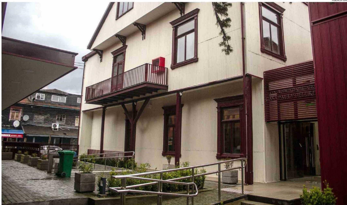
CONSEJEROS REGIONALES Y AUTORIDADES DE LA DIRECCIÓN REGIONAL DE ARQUITECTURA REALIZARON AYER UNA VISITA TÉCNICA A LA REMODELADA CASA PAULY, UBICADA EN EL CENTRO DE PUERTO MONTT.