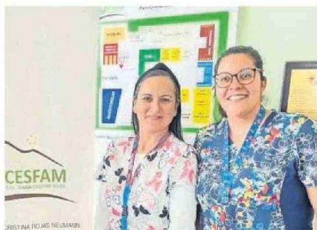
PARTE DEL EQUIPO DEL ECICEP EN EL CESFAM MARÍA CRISTINA ROJAS.

Con esta nueva modalidad, se quiere lograr que las personas tengan participación en su proceso de mejoría o de estabilización. "Busca realizar atenciones integrales según el riesgo que tenga cada una de las personas que se atienden en los establecimientos de atención primaria. Este nivel de riesgo va directamente relacionado con el número de patologías o condiciones crónicas que tienen cada una de las perso-