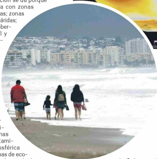
EL DÍA El Cambio Climático es una realidad que debe ser abordada con acciones firmes y concretas, y aunque se han exigido a los organismos regionales, éstos -en su mayoría- están al debe con la ejecución.

territorio de especial importancia, considerando su vulnerabilidad y exposición frente al cambio climático. Sin embargo, lamentaron que por el escaso periodo de consulta defi-