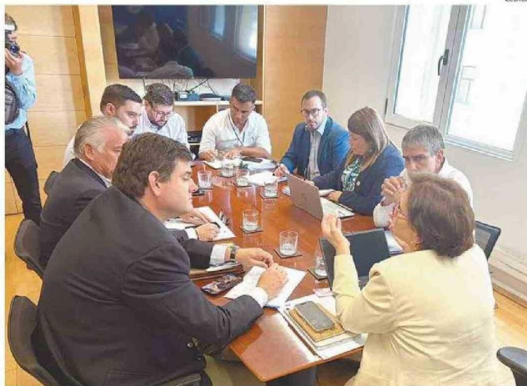
LA REUNIÓN SE CENTRÓ EN LA PETICIÓN DE MÁS SEGURIDAD EN TIEMPOS DE VACACIONES.

En este marco los alcaldes solicitaron medidas urgentes para reforzar la seguridad en zonas turísticas, entre las que destacan la solicitud para que el operativo enjambre se despliegue a regiones donde se encuentran las grandes masas de ciudadanos que provienen de