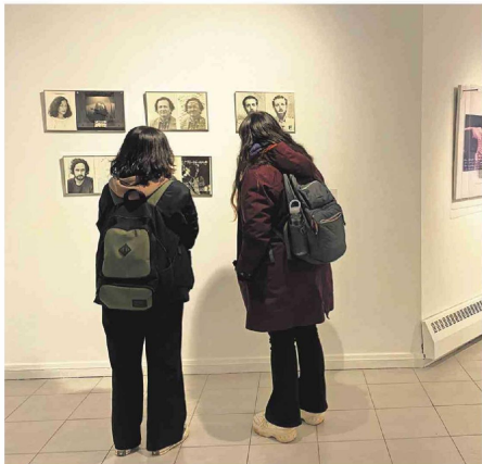
Fotografías, pinturas y esculturas dan vida a una muestra de amplias materialidades y colores.