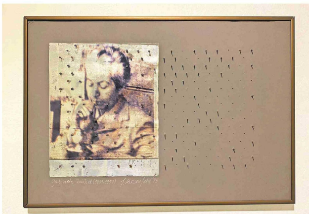
La monocopia “Gabriela Mistral 1889-1957” (1995) de Lotty Rosenfeld homenajea a la poetisa.