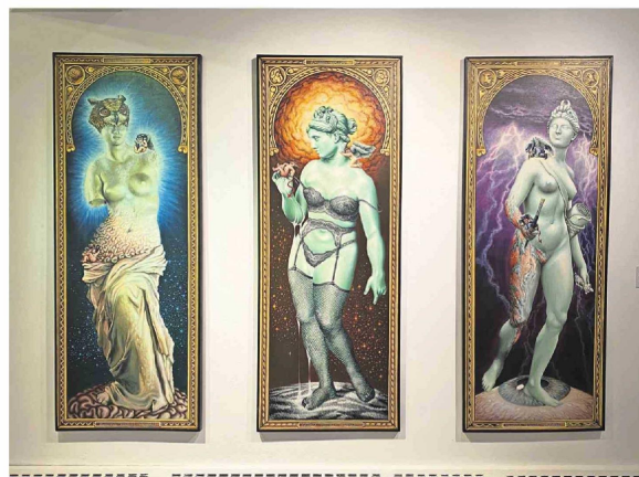
“Es duro ser Venus” (1995) son óleos sobre tela de Marcela Trujillo.