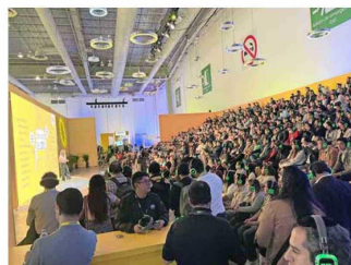
Además de presenciar las conferencias, los asistentes al encuentro contarán con información de medios de pago, transformación digital, logística y estrategias de marketing.