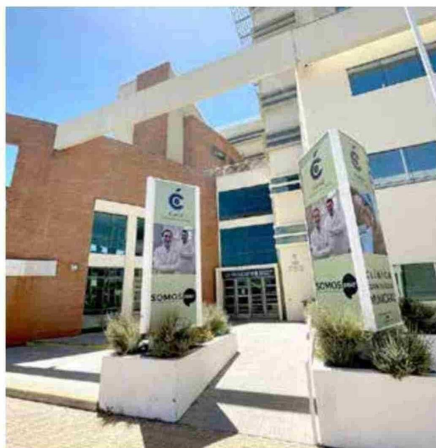
La Clínica Odontológica Municipal, está instalada en el antiguo edificio de La Araucana.