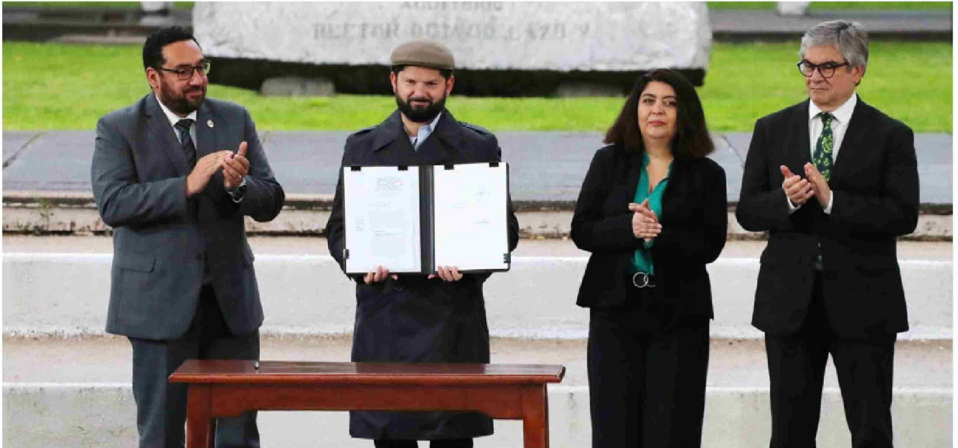
► En el gobierno asumen que para que el proyecto salga adelante, deben estar abiertos a modificaciones.