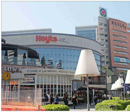
El anuncio de Parque Arauco fue bien recibido en el mercado. Sus acciones subieron un 3,64%, a $1.668,6 por unidad.