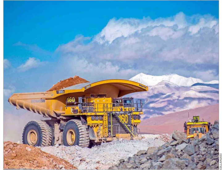
El costo de producir cobre en Chile disminuyó en la primera mitad del año pasado, pero sigue sobre el promedio de entre 2015 y 2021.

Respecto del costo asociado a la regulación, Guajardo opina que "el aumento en las exigencias está ocurriendo a nivel mundial, aunque hay indicios de que se podría revertir la tendencia a la sobreregulación. En el caso particular de Chile, el aumento de regulaciones perdió la visión de conjunto y hoy enfrentamos una situación en que existen redundancias y complejidades innecesarias, además de oportunidades para que diversos actores intervengan en el proceso de