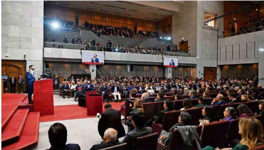
UN DISCURSO BASADO EN DEFENDER LO HECHO EN MATERIA DE SEGURIDAD Y ECONOMÍA OFRECIÓ EL MANDATARIO EN EL CONGRESO NACIONAL.

El giro valórico en la agenda de La Moneda marcó uno de los principales énfasis del discurso presidencial, una comparecencia de 2 horas y 42 minutos, en las que insistió reiteradamente en la estabilización económica de su administración, y donde hizo 61 anuncios.