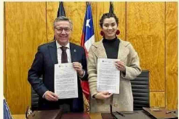
El acuerdo selló alianza entre ambas instituciones para proyectar trabajos en temáticas de patrimonio, turismo, cultura y educación.

áreas donde abordan acciones en torno a la conservación, restauración y también a la difusión cultural. Entonces, "hay un abanico de posibilidades tremenda en las que podemos vincularnos con la Universidad San Sebastián, generar proyectos en conjunto y hacer crecer este apego territorial, no solamente de las personas que habitan Chiloé, sino también de toda la Región de Los Lagos", concluyó.