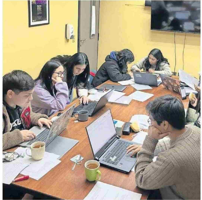
EQUIPO DE INVESTIGACIÓN DE LA UCT.