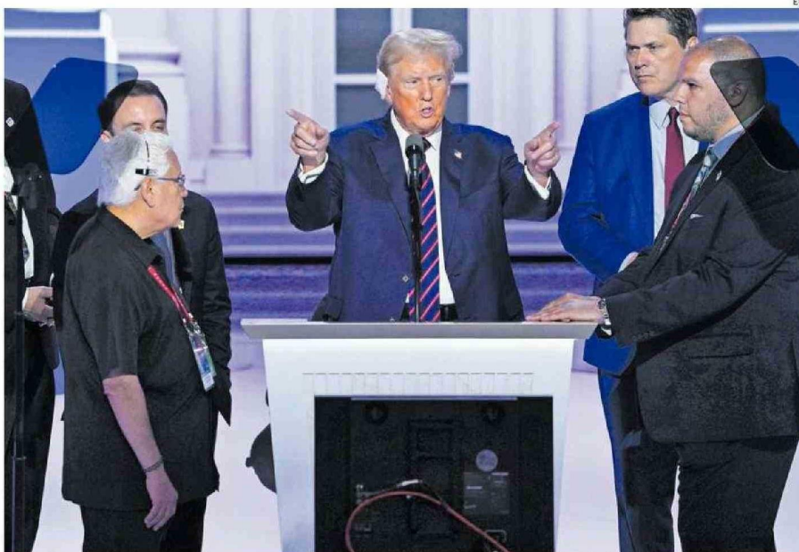
TRUMP DEBERÁ ACEPTAR HOY LA NOMINACIÓN DE SU PARTIDO EN LA CONVENCION DE MILWAUKEE PARA CORRER OFICIALMENTE A LA CASA BLANCA.

Cheatle ha dicho que la agencia comprende la importancia de la investigación ordenada por el presidente demócrata Joe Biden y que participa