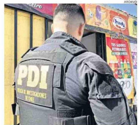
OPERATIVO SE ENMARCO EN UN PLAN NACIONAL DE FISCALIZACIONES.