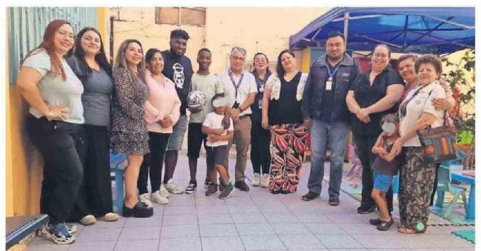
LA EMOTIVA DESPEDIDA EN LA RESIDENCIA FAMILIAR ANTES DE VIAJAR A SANTIAGO.