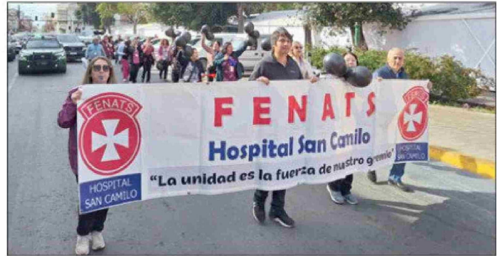
Trabajadores de la Central de Alimentos del Hospital San Camilo marcharon por el centro de San Felipe.

Respecto de las problemáticas que se han generado en esta unidad en el último tiempo, Gutiérrez dijo que «hoy los trabajadores están agotados, ya no dan abasto con la carga laboral que existe. Un