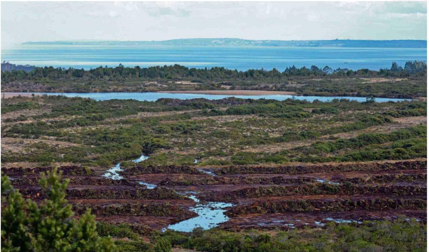
LA SUPERINTENDENCIA DEL MEDIO AMBIENTE FORMULÓ CARGOS CONTRA LA INMOBILIARIA POCURO SPA DEBIDO A LA AFECTACIÓN DEL HUMEDAL URBANO UBICADO EN VALLE VOLCANES.