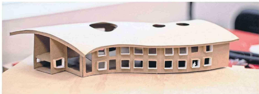
La nueva carrera aborda y propone un enfoque desde innovación, el emprendimiento y la sustentabilidad.