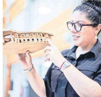
La Arquitectura ha experimentado avances significativos que están marcando un antes y un después en el diseño urbano y la construcción. Villouta comentó que "esto está relacionado con las transformaciones que tienen actualmente los territorios y las ciudades contemporáneas".

"Comunas como Hualpén y Talcahuano ya no cuentan con espacios suficientes para crecer, lo que ha complicado el desarrollo del Gran Concepción. Como resultado, el crecimiento se ha dirigido hacia San Pedro de la Paz, debido a la falta de legislación y protección de los sistemas naturales, generando una constante lucha entre la coordinadora y las asociaciones para avanzar de manera sostenible y conjunta, integrando