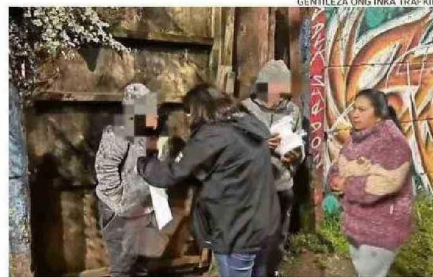
LA ENTREGA DE ALIMENTOS EN LAS CALLES ES UNA DE SUS LABORES.

Existen personas que escriben pidiendo ayuda para un caso específico, y todo se recibe. La gente nos contacta a través de las redes, nos cuenta un poco la historia, verificamos que sea real y luego organizamos la campaña. La comunidad sabe que, aunque no se trate necesariamente de niños o de personas en situación de calle, si es un caso importante, lo recibire-