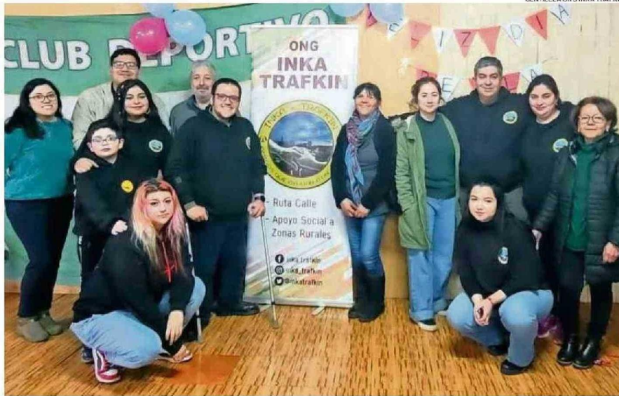
LA ONG INKA TRAFKIN FUNCIONA CON VOLUNTARIOS Y DE MANERA INDEPENDIENTE. RECIBEN A NUEVOS INTEGRANTES "QUE SEAN CONSTANTES".

"Cada lugar al que vamos es como una novedad, porque llegamos con el Viejo Pascuero, con regalos, juegos, dinámicas y diferentes actividades. Nos piden que volvamos, y se va todo el año. Son localidades que, aunque quizás no estén tan aisladas en términos de modernidad, tienen muchas necesidades. Justamente, la ayuda no llega a esos lugares porque están lejos, o porque a veces el montaje de las actividades es complicado. Sin embargo, nuestro objetivo