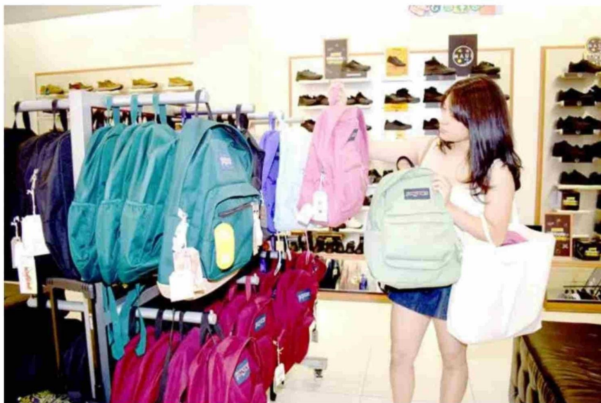
Ayer se pudo apreciar un aumento en la cantidad de clientes que buscan uniformes y útiles escolares.

• El comerciante señaló que la tendencia no va al alza, porque hay variables: "Una puede estar en el tema económico, que el país está con problemas, el costo de la vida está muy alto. Subieron los sueldos, pero en realidad no se nota mucho", manifestó.